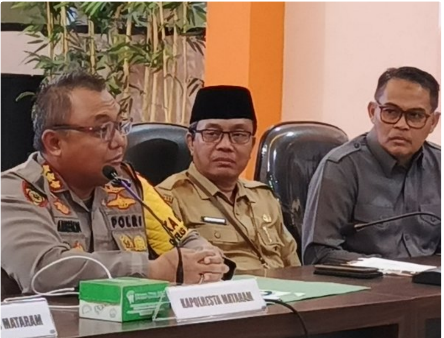
Kapolresta Mataram (Kiri) saat memimpin Konferensi pers akhir tahun, Selagi (31/12/2024)

MATARAM, NTB – Polresta Mataram mengakhiri tahun 2024 dengan menggelar Konferensi Pers Akhir Tahun, sebuah forum transparansi untuk memaparkan capaian dan inovasi yang telah dilakukan selama satu tahun. Kegiatan yang