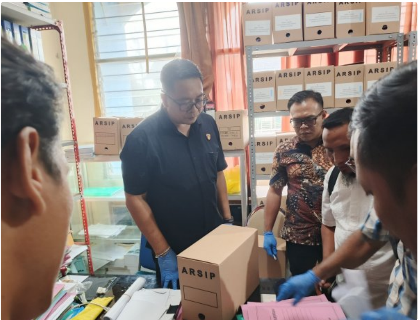
Saat Pengeledahan di Dikbud NTB, Jumat (13/12/2024)